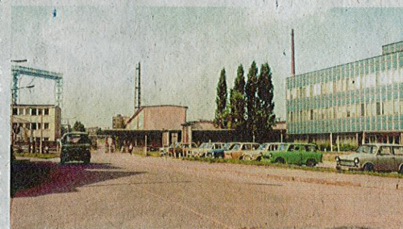
Der „Blauer Bock“ stand schon 1972 für moderne Architektur.