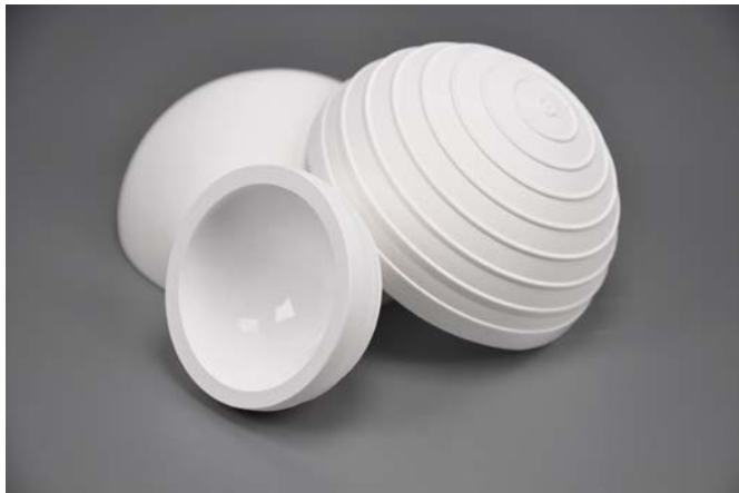
Abb. 1 Die gegossenen Halbschalen für die Oberflächenersatzprothese sind auf einer Seite aufgeraut, damit die Knochenzellen besser anwachsen. Die andere Seite ist jeweils vollkommen glatt.

Das Verbundprojekt CERAMIC Bonepreserver wurde im September 2020 abgeschlossen und vom Freistaat Thüringen mit 800 000 Euro gefördert. Das Projekt kommt zur rechten Zeit. Gesundheitsexperten rechnen damit, dass durch die steigende Lebenserwartung der Bevölkerung auch die Zahl der Hüftgelenkoperationen ansteigen wird. Denn die meisten Operationen werden in der Altersgruppe der 70- bis 80-Jährigen vorgenommen. Die keramischen Hüftgelenk-Prothesen leisten hier einen wichtigen Beitrag, damit Operationen und der anschließende Heilungsprozess weitgehend schmerzfrei und ohne Komplikationen verlaufen.